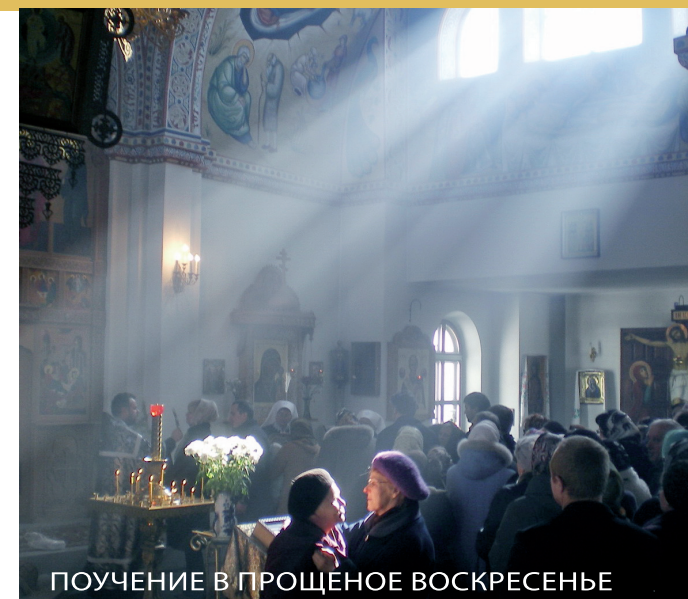
ПОУЧЕНИЕ В ПРОЩЕНОЕ ВОСКРЕСЕНЬЕ

На фото: Четырехчастная икона. Целование Иуды, Христос перед Каиафой и Анной, Отречение Петра, Приведение Христа к Понтию Пилату. Место хранения: Новгородский государственный объединенный историко-архитектурный и художественный музей-заповедник